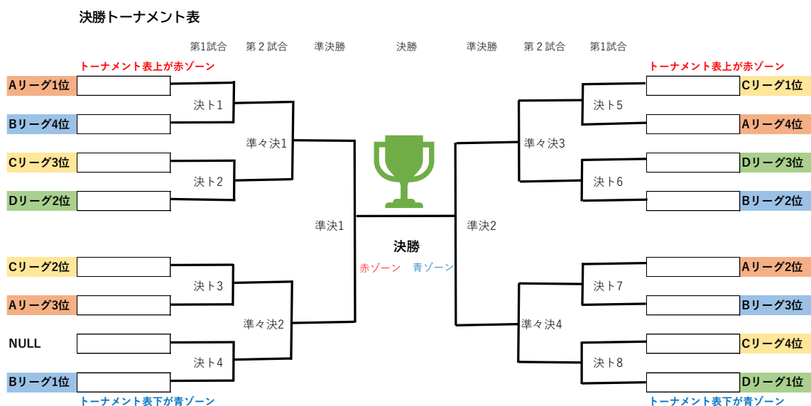
決勝トーナメント表